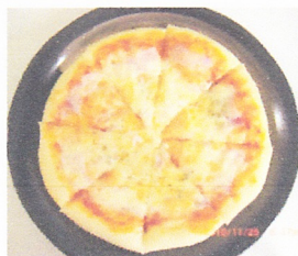
トマトソースピザ 1000円 定番トマトソース味