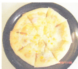
ツナマヨソースピザ 1100円 好きがあります