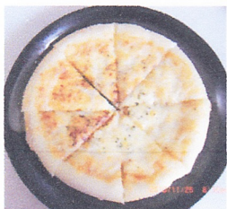
味噌ソースピザ 1100円 スイーツ風味味噌